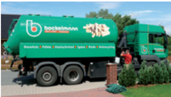
Lose Ware wird Ihnen von unserem Spezialtransporter M12 angeliefert und schonend ins Lager gepumpt.

HOLZPELLETS sind genormte, zylindrische Presslinge, aus Sägewerksnebenprodukten wie z. B. Sägemehl oder Hobelspäne. Sie werden unter hohem Druck ohne chemische Zusätze gepresst. Neben den holzeigenen Ligninen und Harzen, die für die Festigkeit sorgen, dürfen ihnen max. 2% natürlicher Stärke beigemischt werden. In den von uns gelieferten Pellets ist max. 0,5% Stärke enthalten!